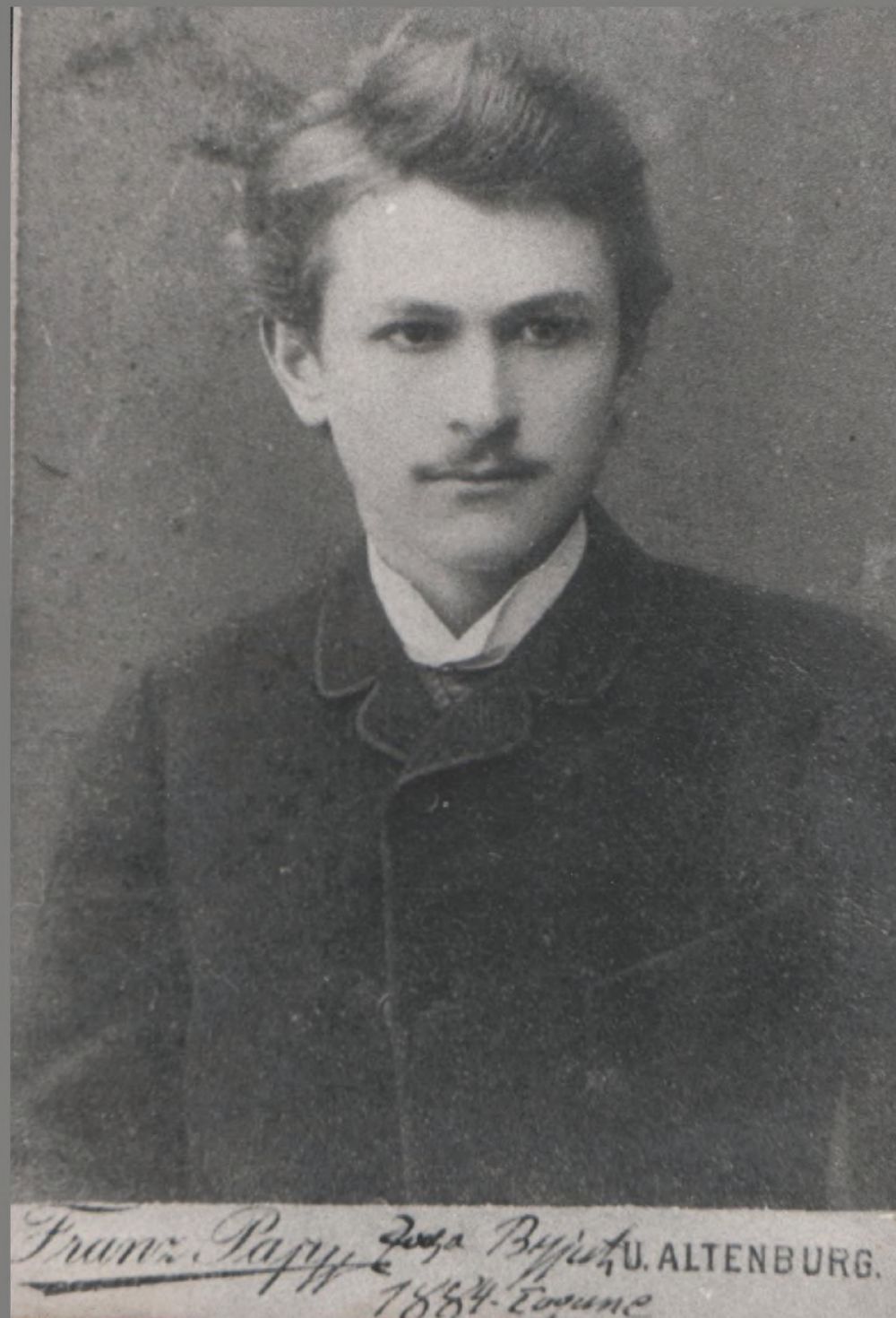
Arhiva porodice Vujić

Knjiga je rezultat projekta „Digitalizacija i prezentacija kulturnog i naučnog na-