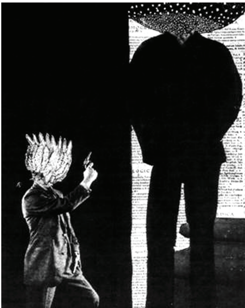
Мутан лов у бистрој води

Време излагања на Научном скупу ограничено је на 15 минута.