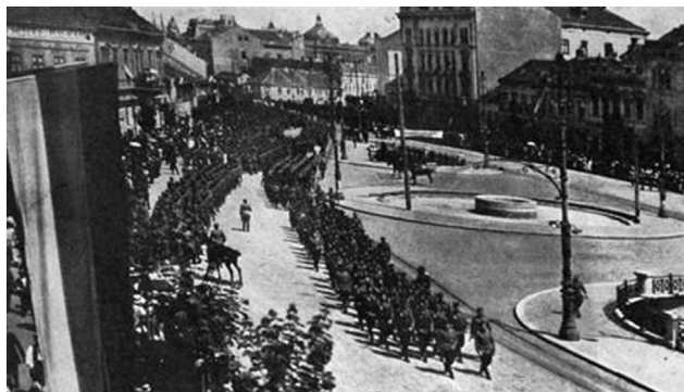
Испраћај српске војске у Први светски рат 1914. године

Церска битка, знана и као Битка на Јадру, вођена на планини Церу, у Мачви и Подрињу, почела је између 15. и 16. августа 1914. године. Представља прву победу савезника над Централним силама. Аустројска команда, као изненађење, планирала је напад из правца Босне, преко Дрине. Српска команда очекивала је да главни правци наступања аустроугарске Балканске армије буду преко Саве и Дунава. Битка је завршена потпуним сломом аустроугарских трупа и њиховим бекством из Србије, и окончана је српским заузимањем Шапца 24. августа 1914. године. Битка је била маневарског типа и генерал Степа Степановић је после ње унапређен у чин српског војводе због зналачког вођења и сјајног маневра на Церу и заузимања коте Косанин град што се показало као пресудни моменат за исход битке. Обе стране имале су значајне губитке, а први пут су се манифестовала зверства