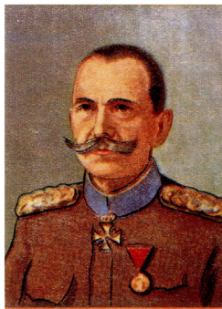
Војвода Петар Бојовић

Четири војводе: Радомир Путник, Живојин Мишић, Степа Степановић и Петар Бојовић