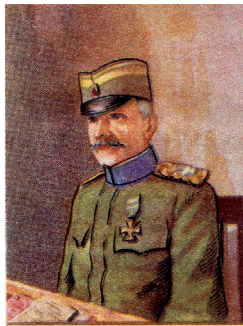
Војвода Живојин Мишић