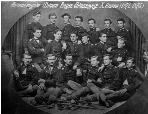
Артиљеријска школа Војне академије X класа (1871-1875)

личностима које су персонификовале борбу српског народа у непрекидним ратовима током пуних осам година, у почетку за ослобођење свог националног простора, касније за одбрану, и на крају, за чисту, голу егзистенцију на светској историјској сцени. Пут који је прешла та истинска елита