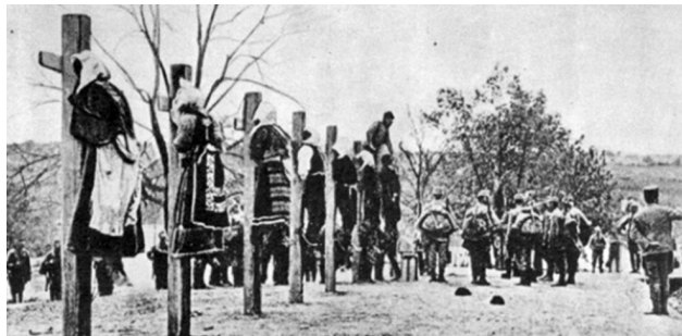
Аустроугарско убијање цивила у Мачви

Битка на Дрини и српско повлачење могу се посматрати као део јединствене аустроугарске