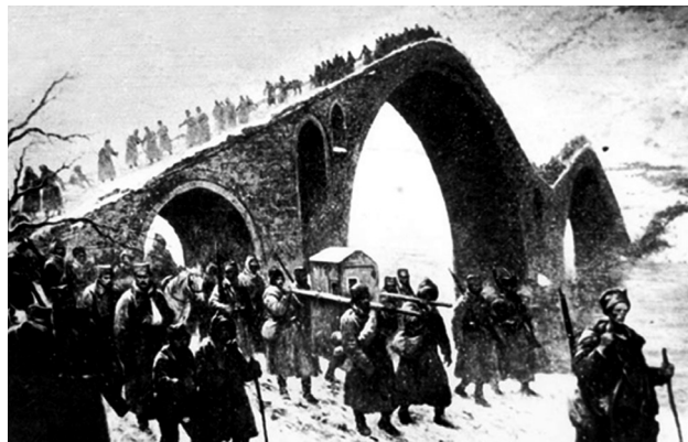
Голгота - повлачење српске војске кроз Албанију

Бугарске као покушај потпуног затирања српског идентитета, Топлички устанак из 1917., под вођством Косте Пећанца, и масовна погибија становништва Топлице, само су неке од манифестација укупних дешавања у окупираној Србији Забележена је и прва појава концентрационих логора на тлу Европе, на територији тадашње