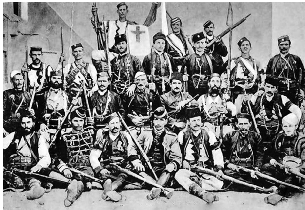
Српске војводе у Јужној Србији и Македонији, фотографисање 1908. године

Појам „Стара Србија“ је кроз историју обухватао различите територије а то су, у најширем смислу, географски појмови у које спадају: Македонија, Скопско-кумановско тетовска