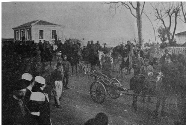
Уношење Бадњака у Драч 1913. године

Други балкански рат вођен је од 29. јуна 1913. до 31. јула 1913. године. Учесници су Бугарска, с једне стране и Србија, Црна Гора, Румунија, Грчка и Турска са друге. Сукоб је иницирала Бугарска услед незадовољства расподелом територија после Првог балканског рата. Завршен је поразом Бугарске. Букурешким споразумом од 10. августа 1913. склопљеним између Бугарске, Србије, Грчке и Румуније, и посебним уговором у Цариграду између Бугарске и Турске, постигнут је договор о расподели територија и разграничењу између држава учесница. Букурешки мировни споразум био је на снази до избијања Великог рата када се Бугарска ставила на страну Централних сила, док су остале учеснице изузев Турске биле на страни Антанте. Победа грчких снага у бици код Кукуша, одолевање српске војске и напредовање у Вардарској долини, и код Пирота и Ниша, провоцирају напад