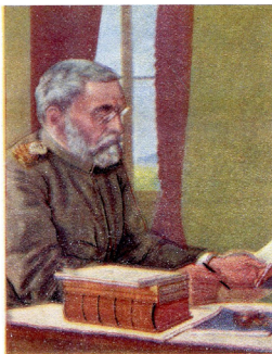
Војвода Радомир Путник