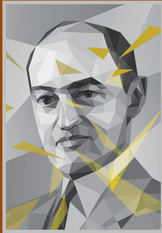
Йозеф Шумпетер (1883-1950)